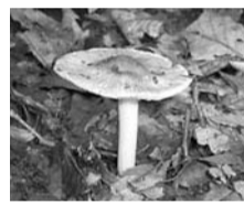
イッポンシメジ科の仲間