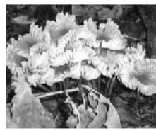
オオホウライタケ