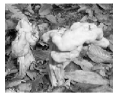
ノポリリュウタケ