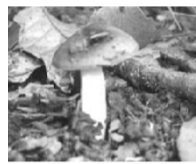
ベニタケ科の仲間