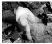
クラガタノポリリュウタケ